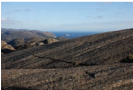
Fig. 2a. Skurestriper Fig. 2a: Glacial striations

plagioklas. Området preges også av mange årer/ganger av en yngre kvartsholdig bergart som skjærer igjennom anortositen. Gangene er fra få ca opp til ca 10 cm tykke (se forsidefoto). På mange av de glatte fjellssidene kan du se spor etter isen, horisontale skurestriper (se figur 2a) og stein i forskjellige størrelser ligger strødd utover området, etterlatt av isen (se figur 2b).