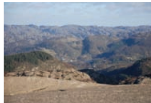
Fig. 4 Utsikt fra varden på toppen mot øst og mot Europas største lagdelte intrusjon, Bjerkreim-Sokndal intrusjonen. Jotunitten i Eia-Rekefjord intrusjonen er den nærmeste delen av stripen med grønt. Hellenen anortositen er i forgrunnen og Åna-Sira anortositen ses i det fjerne som bare åser.

inn) i Hellenen anortositen som da var vertsbergart for disse; den sydlige delen av den lagdelte Bjerkreim-Sokndal intrusjonen og Eia-Rekefjord jotunitten. Lengre mot øst på den andre siden av det bevokste området ses runde bare åser som tilhører Åna-Sira anortositen (se figur 4). Utbredelsen av Hellenen anortositen er ca 4 km ut til kysten (hvor den fortsetter utover under havet) og minst 6 km vestover og ca 19 km nordover. Bergartstypen anortositt består av over 90 % av mineralet plagioklas. Ser du nærmere på bergarten under føttene dine kan du se de enkelte plagioklas-korn, og måler du størrelsen på dem forstår man at Hellenen anortositen består av tusenvis av millioner med plagioklas krystaller!