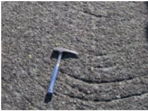
Fig. 5b: Konkave sigdemerker, isens bevegelse opp i bildet

Fig. 5b: Crescent-shaped 'chatter marks'. The movements of the ice was upwards in the photo.