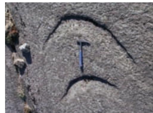
Fig. 5a: Konvekse sigdemerker, isens bevegelse opp i bildet

The size of the Hellenen anorthosite body can be appreciated from here. It extends to Rekefjord harbour which can be seen to the south east. The vegetated, relatively low-lying area north of Rekefjord consists of crystalline rocks that intruded into the Hellenen anorthosite: the southern part of the Bjerkreim - Sokndal layered intrusion and the Eia-Rekefjord jotunite. The rounded, rocky outcrops farther to the east belong to the Åna-Sira anorthosite (see fig. 4). The Hellenen anorthosite extends for ~4 km to the coast to the south (and continues beneath the sea), for at least 6 km to the west and for ~19 km to the north. The rock type anorthosite consists of >90% of the mineral plagioclase. The size of the individual plagioclase crystals can be gauged from looking at the rock beneath your feet. It is clear that there must be many thousands of millions of plagioclase crystals in the Hellenen body!