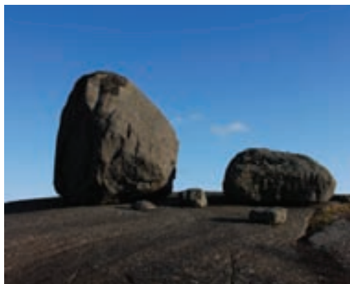
Fig. 2b Flyttblokker Fig. 2b: Erratic blocks

Fra toppen kan man ane størrelsen på Hellenen anortositen. Den går til Rekefjord havn (sydøst). Det skogkledde lavereliggende området nord for Rekefjord består av krystalline bergarter som intruderte (trengte