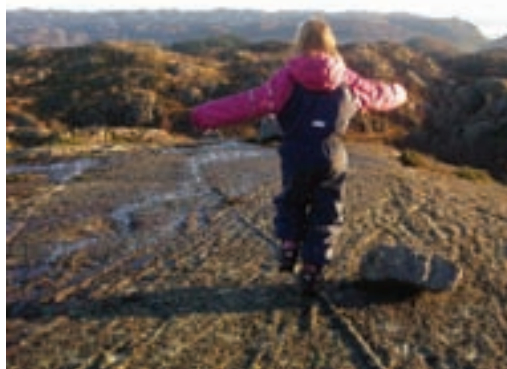
Fig. 3 Granittgang (charnokitt)

After crossing the valley to the east of the summit of Jibbeheia there are many bare rock surfaces in which there are numerous veins of quartz-bearing rock (a kind of granite called charnockite), some of which can be followed for many tens of meters (see fig. 3).